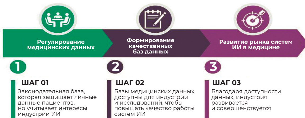
Рисунок 1 — Развитие ИИ с точки зрения безопасности и доступности медицинских данных.